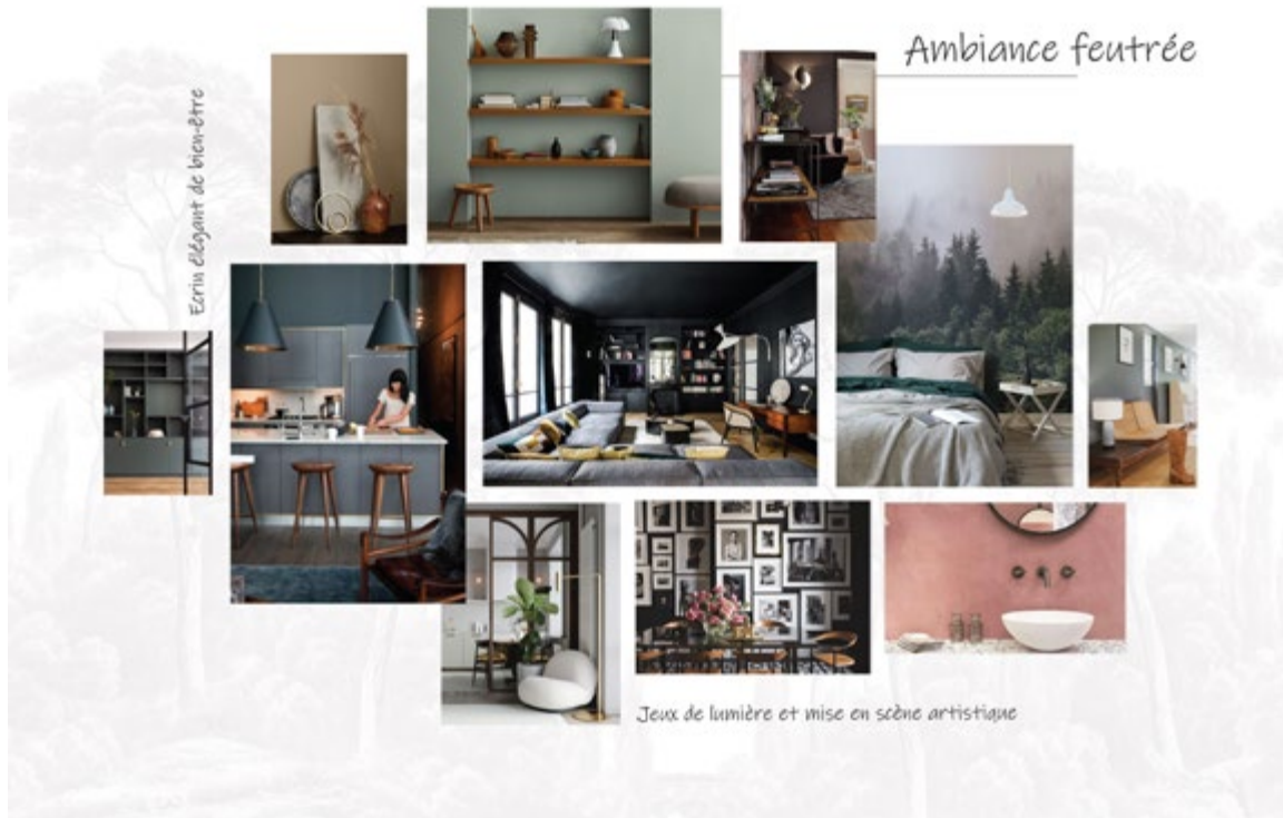
Planche ambiance réalisée par Christina Lopez, décoratrice diplômée de CREAD Pro.