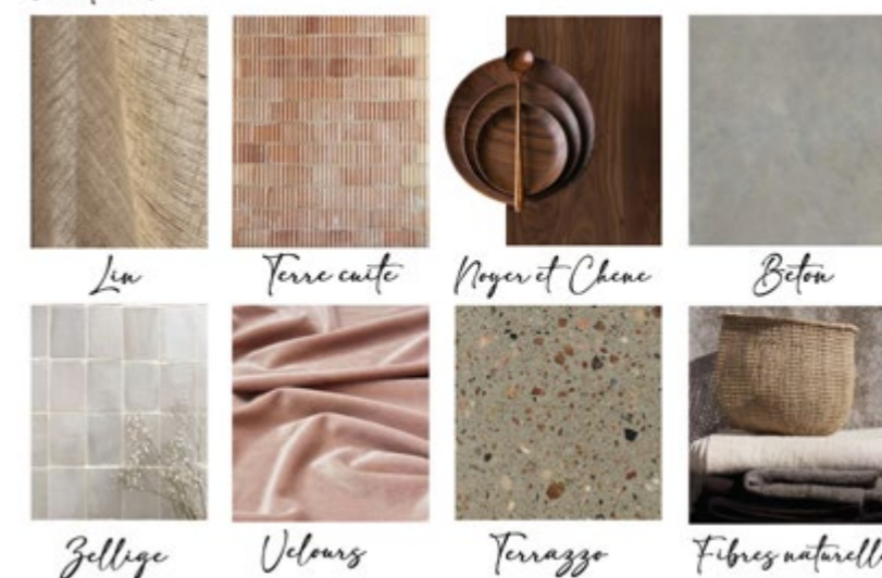
Planche matériaux réalisée par Marylin M'Dallel, décoratrice diplômée de CREAD Pro.