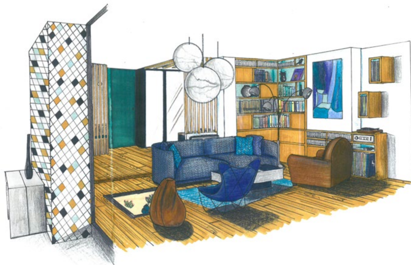
Perspective réalisée par Clélia Peyrusaubes, diplômée de CREAD Pro.

La densité du travail personnel à fournir est importante, le stagiaire devra savoir s'organiser afin de réaliser les rendus demandés par les formateurs.