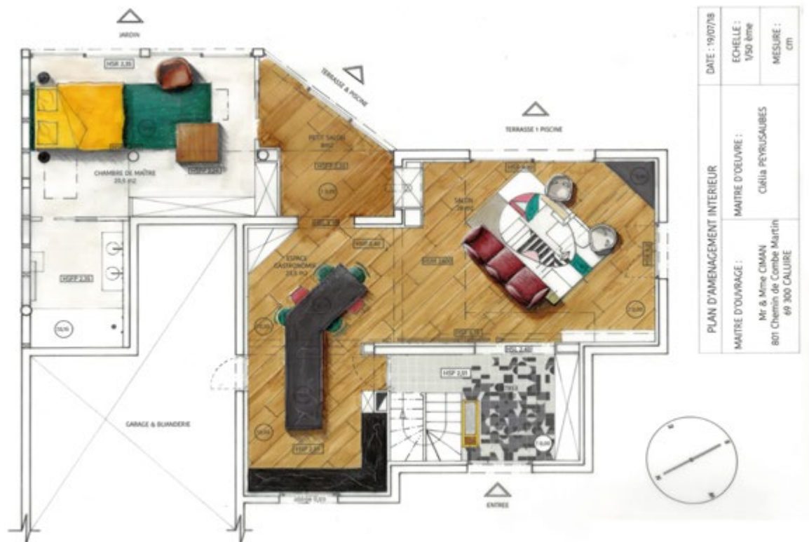
Plan d'aménagement intérieur réalisé par Clélia Peyrusaubes, diplômée de CREAD Pro.