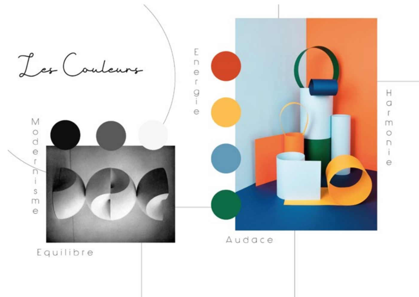
Planche couleurs réalisée par Clélia Peyrusaubes, diplômée de CREAD Pro.