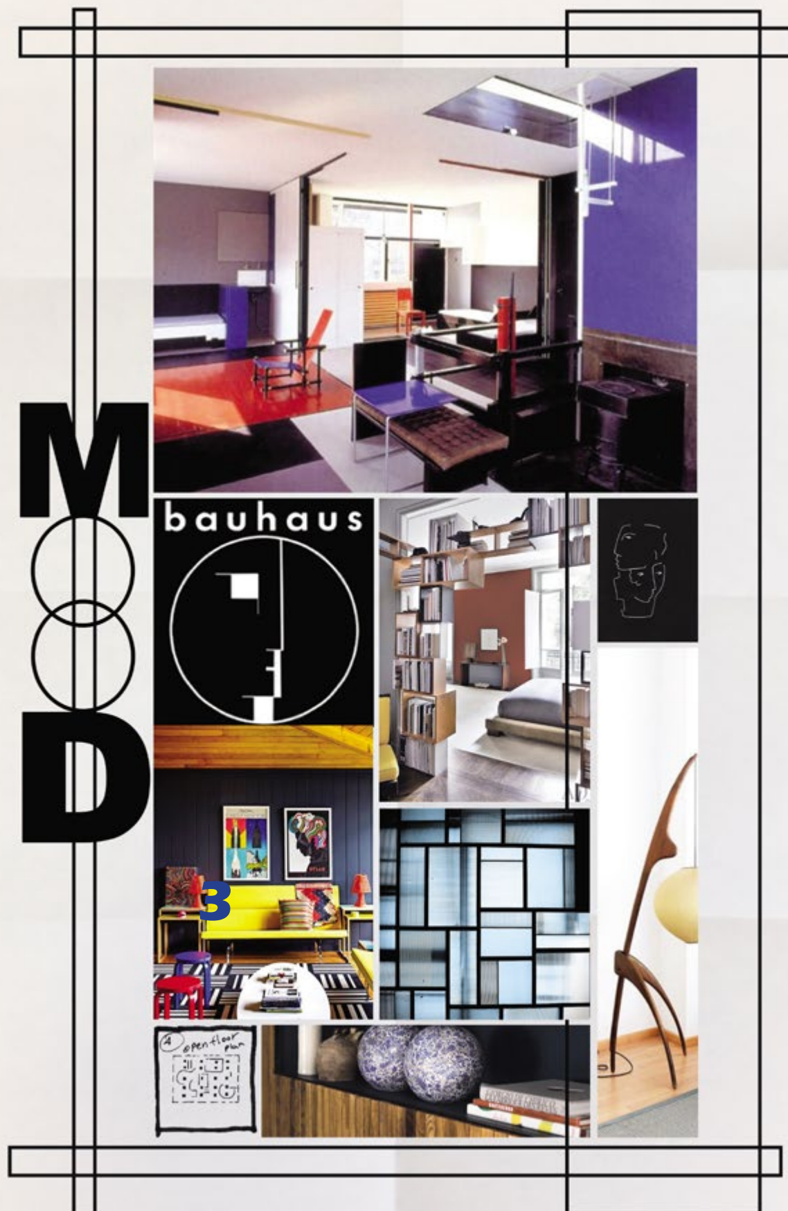
Planche univers réalisée par Jeanne Artiaga, diplômée de CREAD Pro.