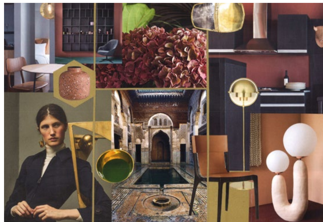
Planche univers réalisée par Sophie Repiton, diplômée de CREAD Pro.

Hélène HUCHET : architecte d'intérieur. Salariée de CREAD.