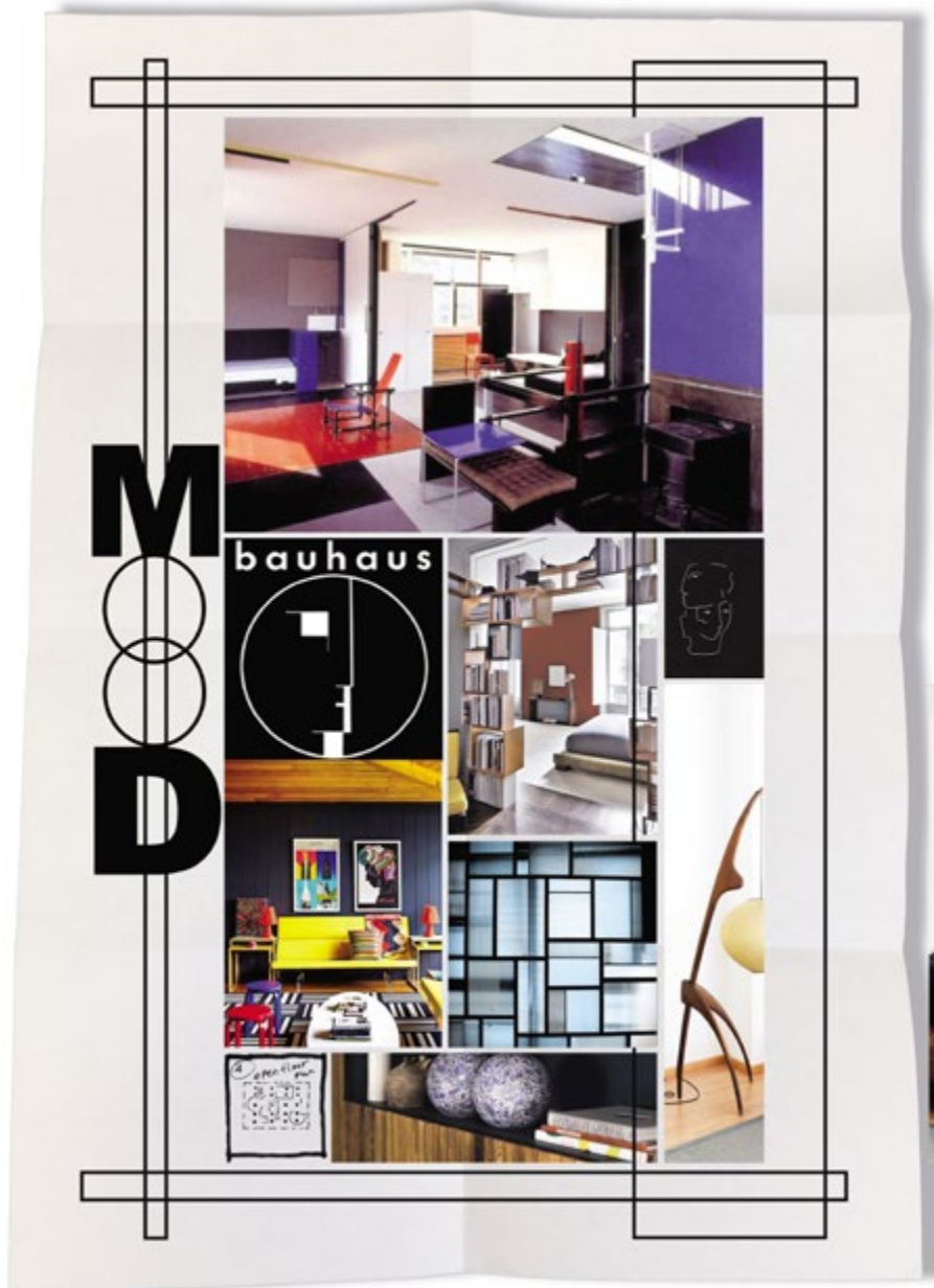
Moodboard réalisé par Jeanne Artiaga, diplômée CREAD Pro.