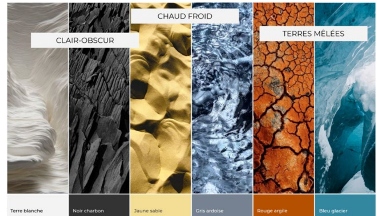
Planche couleurs réalisée par Marie Fourmaux, diplômée CREAD Pro.

Validation du Titre de Décorateur de niveau 3 en capitalisant 180 crédits ECTS (European Credits Transfer System du processus de Bologne). Le jury peut valider tout ou partie des blocs de compétences. Un rattrapage des blocs de compétences est possible en fonction des résultats obtenus.