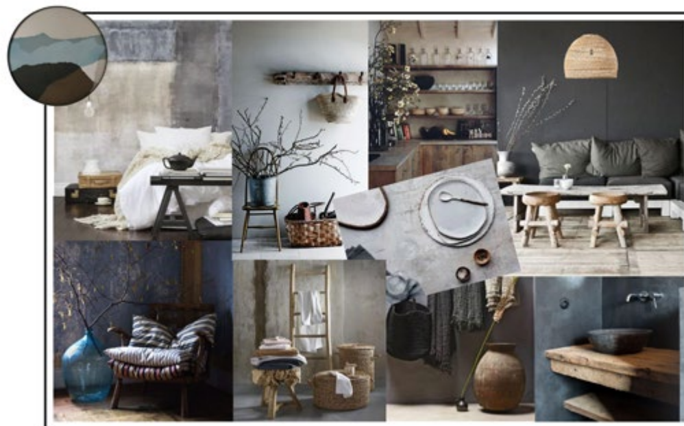
Moodboard réalisé par Valérie Lu, diplômée CREAD Pro.

Le décorateur conçoit des espaces de vie en créant des ambiances. Cela implique une vision globale qui va au-delà du seul choix de revêtements, de couleurs, de mobiliers et de luminaires.