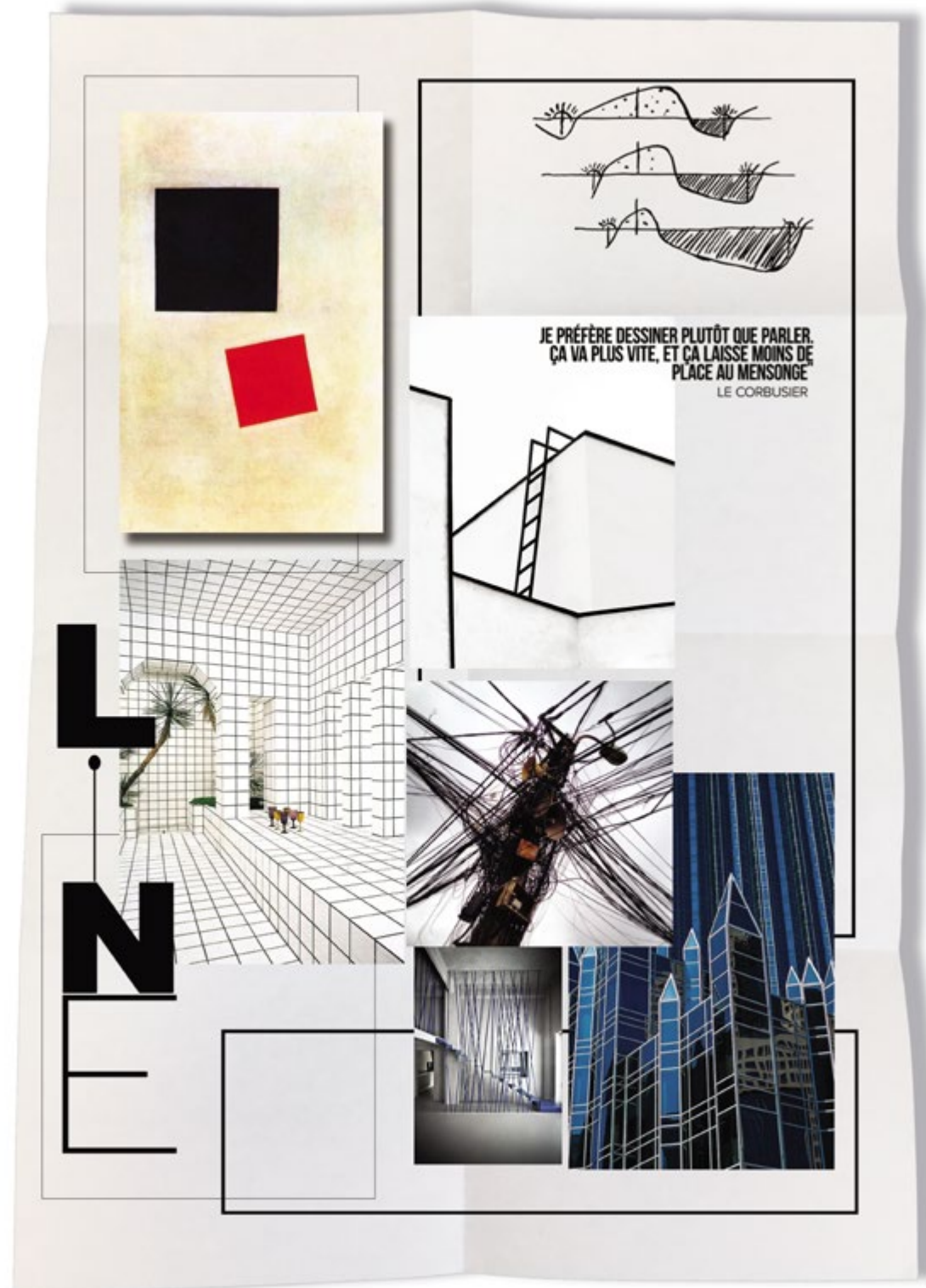
Planche matériaux réalisée par Jeanne Artiaga, diplômée CREAD Pro.

La formation continue et professionnelle permet d'acquérir de nouvelles compétences durant sa vie active pour le retour ou maintien à l'école et pour sécuriser ou optimiser les parcours.