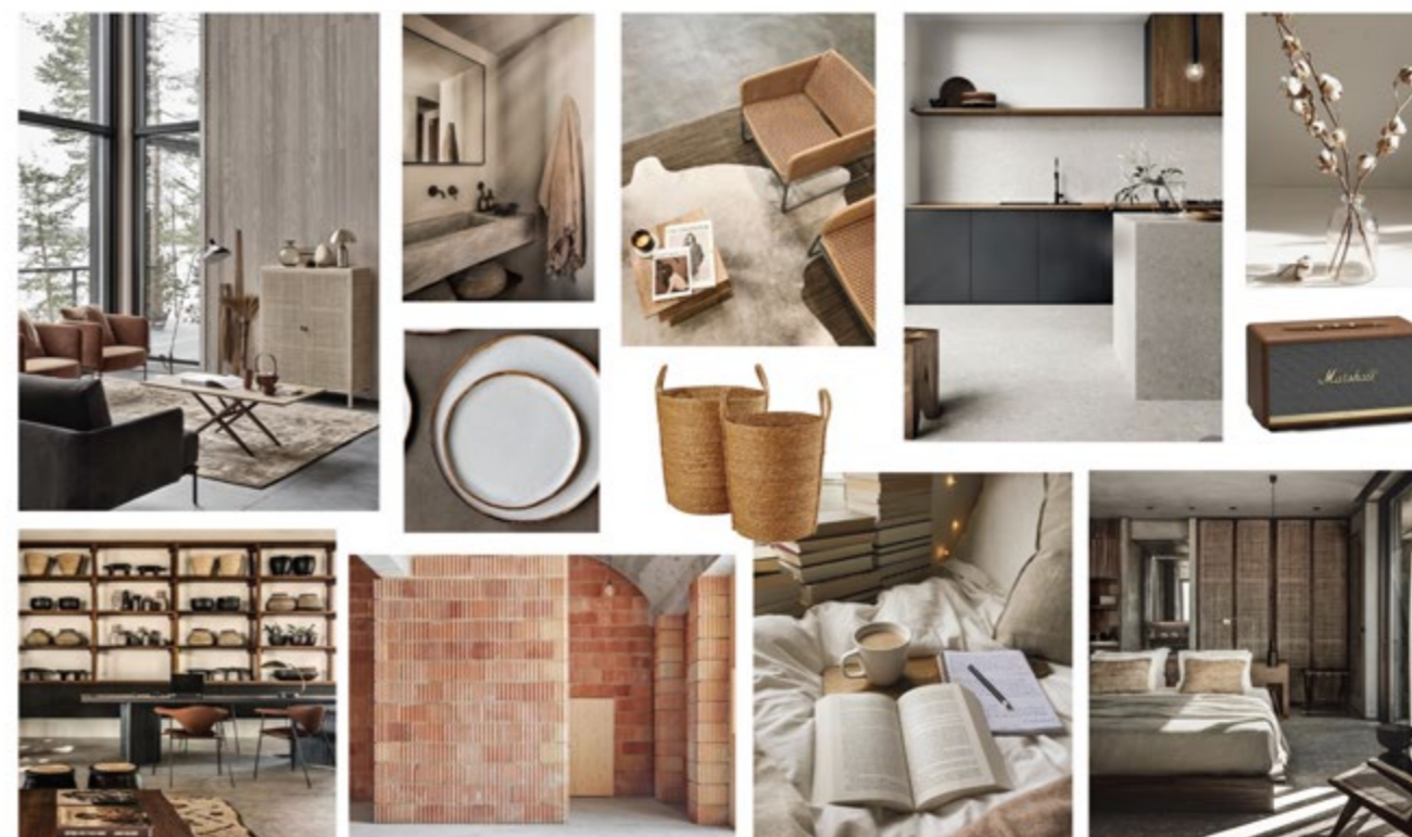
Planche univers réalisée par Marylin M'Dallel, décoratrice diplômée de CREAD Pro.